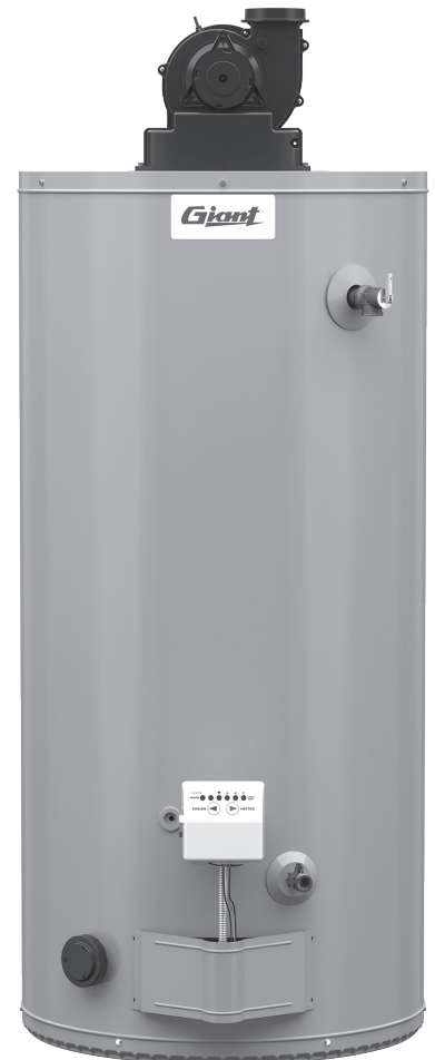
Modèle illustré: UG40-40SPV3-P2 201