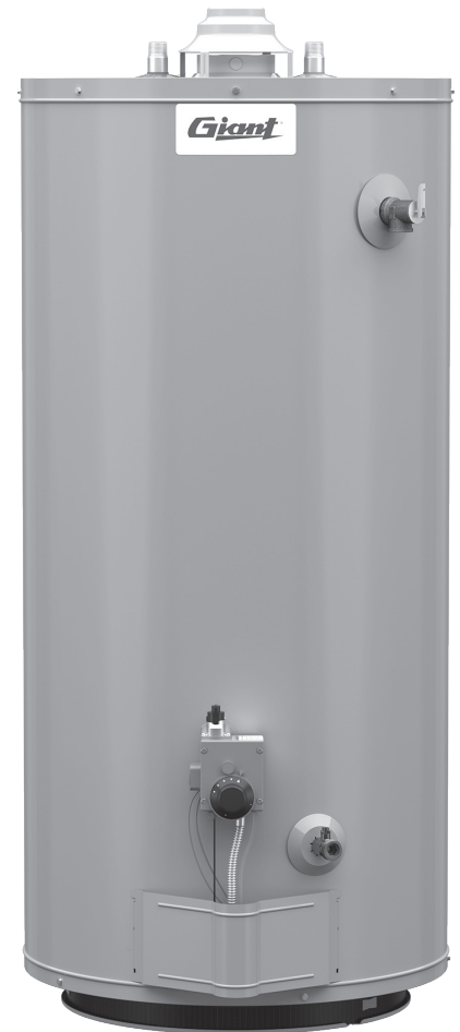
Modèle illustré: UG40-40S3-N2 250