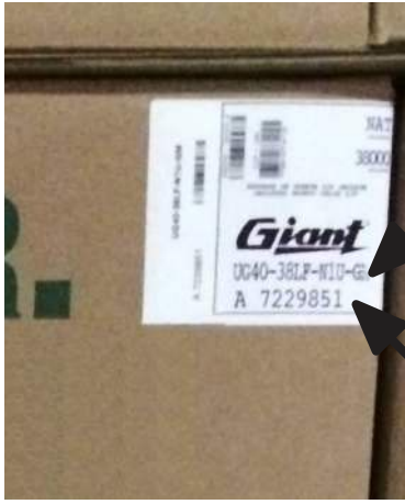
NUMÉRO DE MODÈLE