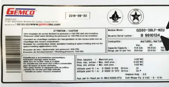
NUMÉRO DE MODÈLE